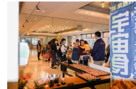
防災食の試食コーナー