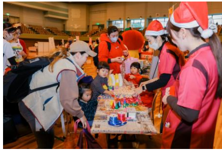
参加型ブースの様子