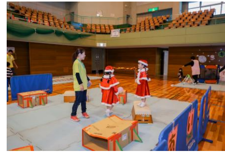
キッズスペース様子