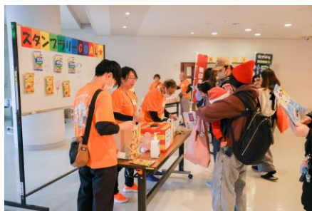
スタンプラリーの様子