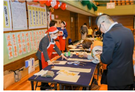
大人気！書道コーナー