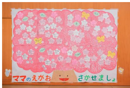
ママのえがおを咲かせた様子