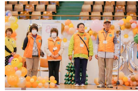
地域のおじさんおばさんも毎年登場！