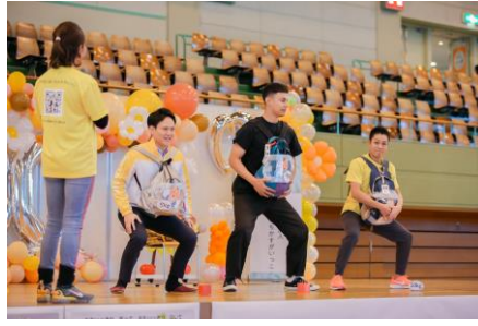
パパ選手権の様子