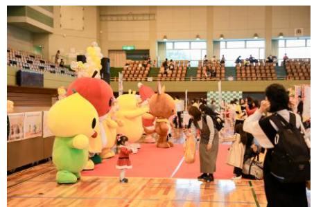
マスコットキャラクター登場