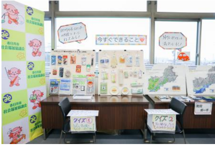
はいはいレースの様子