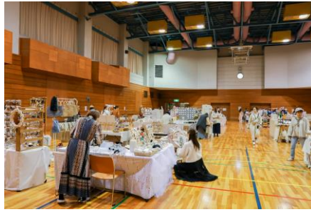
ママブースの様子