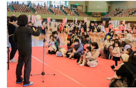
キャラバン隊も参加しています