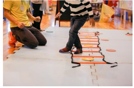
体を動かさずコンテンツ